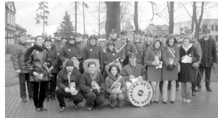
Orkiestra Dęta Rzgów z wolontariuszami WOŚP, Gimnazjum nr 44 w Łodzi