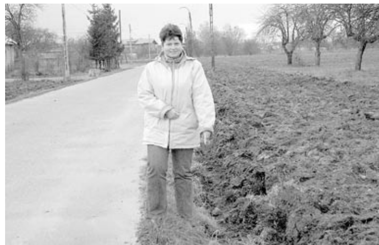
Sołtys Bronisina pokazuje, jaki jest tam głód ziemi. Jeszcze jeden nawrót traktorzysty i... zaorałby asfalt