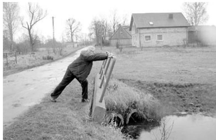
Były sołtys Czyżeminka trzymał się mocno, ale... w końcu zrezygnował z funkcji