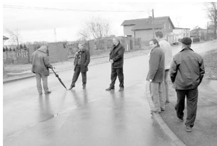
Taniec na drodze