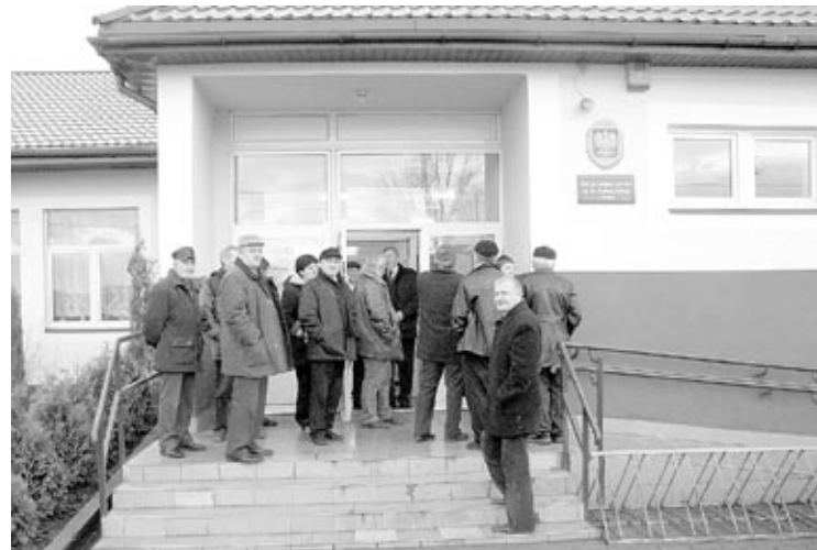
Wrócili do szkoły